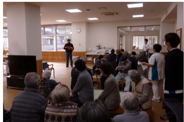
◆四万十清流署、消防署職員による消火器の取り扱い説明