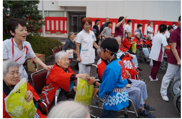
◆子供神輿に参加している子供たちに、お菓子のプレゼント