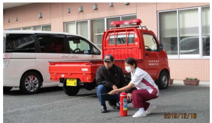
◆入居者、職員による消火訓練の実技