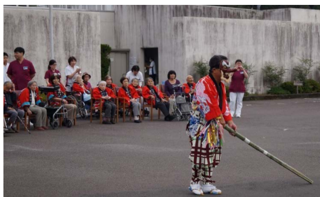
◆天狗による厄払い