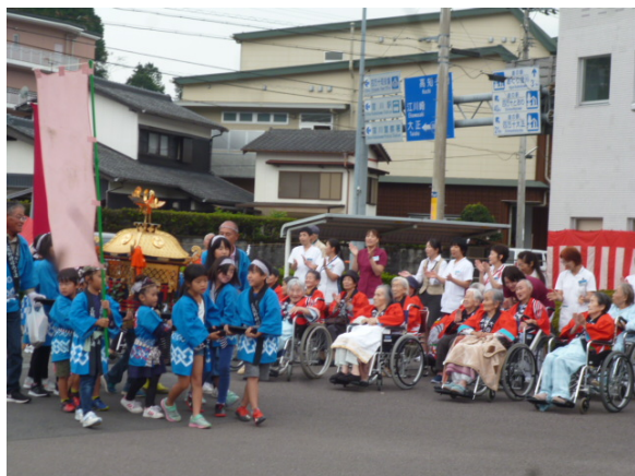
◆子供たちが元気に担ぐ子供神輿