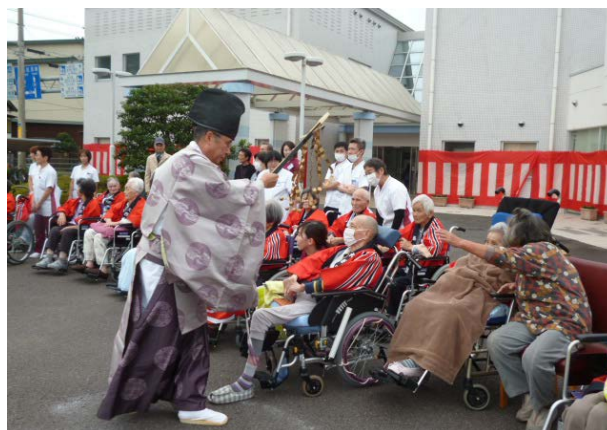
◆神主より祝詞をいただきます