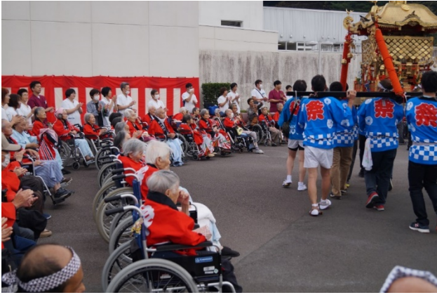
◆はっぴを着て利用者様も一緒に参加します