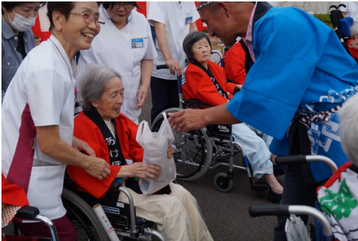
◆参加者様に紅白餅のプレゼント

高幡会では、これからも地域や家族とのつながりを大切にし、入院・入所・入居者様にイベントに参加していただくなかで、日常生活の楽しみや季節を十分に感じていただけるような催しを企画してまいります。