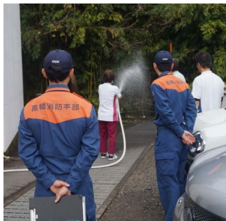
◆ 消火栓を使った消火訓練の様子