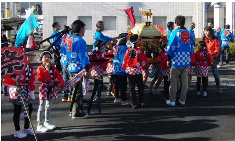
◆子供たちが元気に担ぐ子供神輿