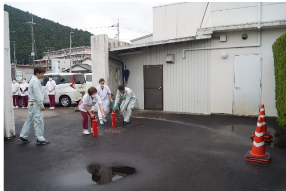
◆ 消火器を使った消火訓練の様子