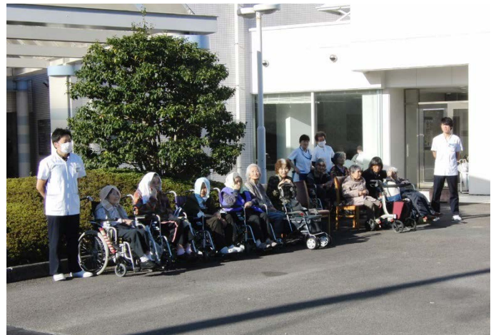
◆利用者様も一緒に参加しました