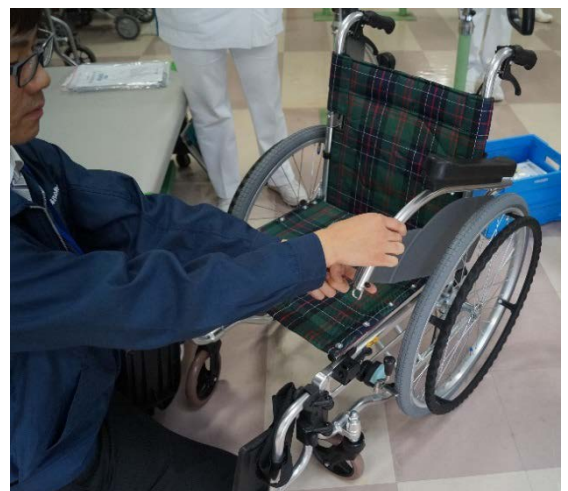
◆メーカー担当者による車いすの使用説明