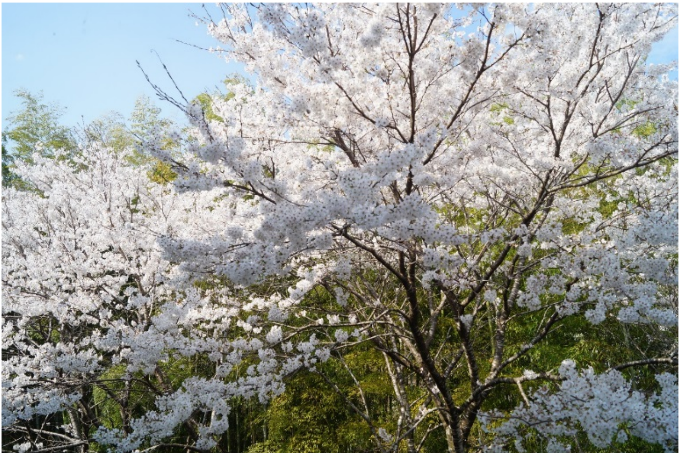
病棟中央ホールから観る桜