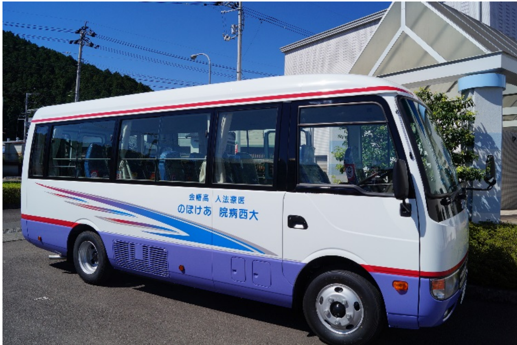
大西病院送迎バス時刻表

大西病院では、患者様サービスの一環として送迎を行っております。 御利用をご希望の方は、(☎0880-22-1191)医事課受付窓口か地域連携室、 もしくは、運転手に直接ご相談下さい。