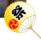
模擬店も大賑わい!