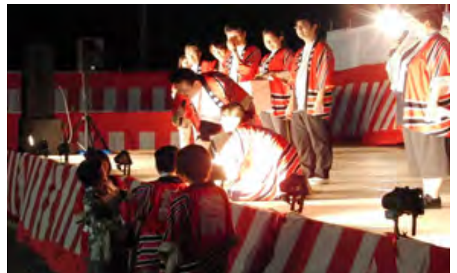
大盛り上がりの大抽選会!