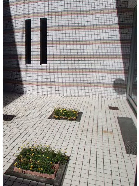
中庭も秋に衣替えしました。