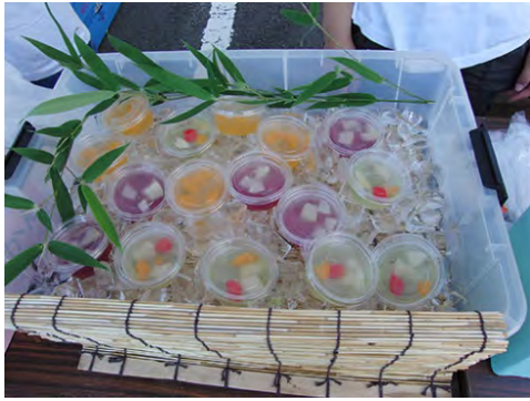
涼しげでおいしそうです…