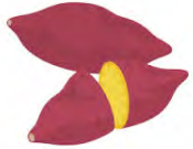
さつまいもご飯 揚げ物盛り合わせ 酢の物 けんちん汁 うさぎりんご

さつまいもご飯の黄色、丸くかたどった海老しんじょう、うさぎりんごで、十五夜の満月をイメージした献立に仕上げました。 また、肌寒い季節を迎えたので、けんちん汁など体を温める献立も今後提供していきます。