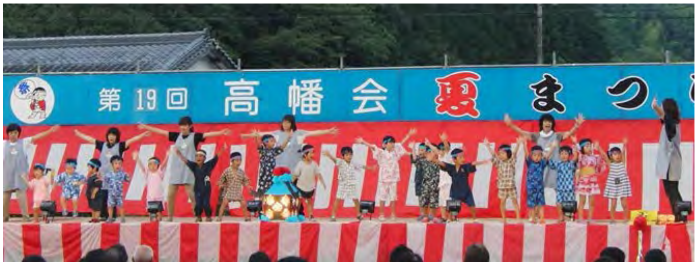
ひかり保育所の園児たちによる熱演!