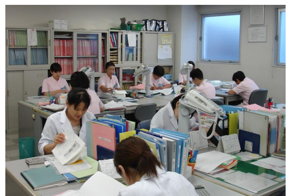
地域連携室スタッフ

どうすればご自宅で快適に暮らせるのかの助言や、ご家族様の急な用事、他のご家族様のお祝いなどで留守にしなければならないような時への助言と対応もさせていただきます。